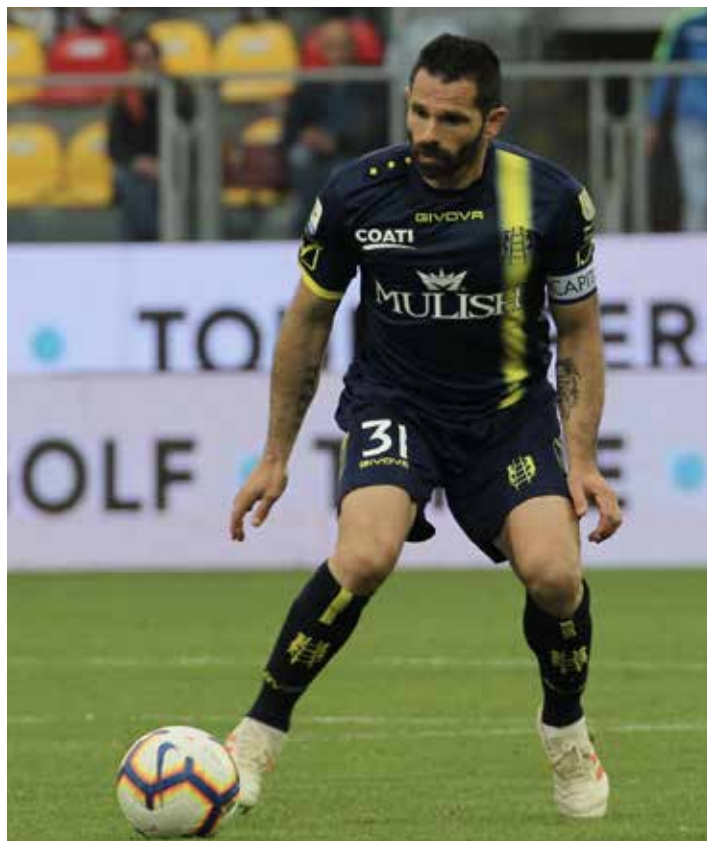
Sergio Pellissier nella sua ultima partita giocata

Il 22 settembre 2002 l'attaccante di Aosta fa il suo esordio in Serie A con la maglia gialloblu del Chievo nella partita contro il Brescia persa 2 a 1. Ha 23 anni e subito si mette in luce per le sue caratteristiche di seconda punta che preferisce giocare largo per puntare a rete con il suo scatto bruciante. Il fiuto del gol non gli manca. Il 25 maggio 2019 dà l'addio al calcio giocato proprio sul terreno di gioco del "Benito Stirpe" mentre la sua squadra e il Frosinone salutano la Serie A dopo aver chiuso l'incontro sullo zero a zero. Gli applausi anche da parte dei tifosi ciociari sono tutti per lui come gli abbracci da parte dei suoi compagni e degli avversari giallazzurri. Sergio Pellissier esce dal calcio giocato all'età di quaranta