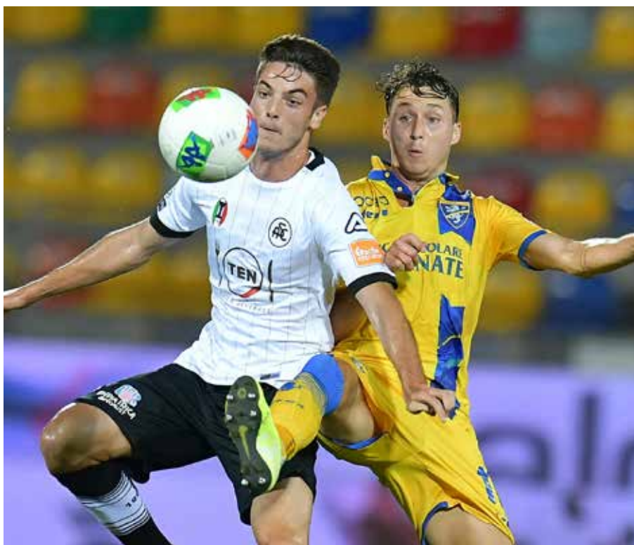
Un contrasto di gioco dell'ultima gara giocata lo scorso 3 luglio